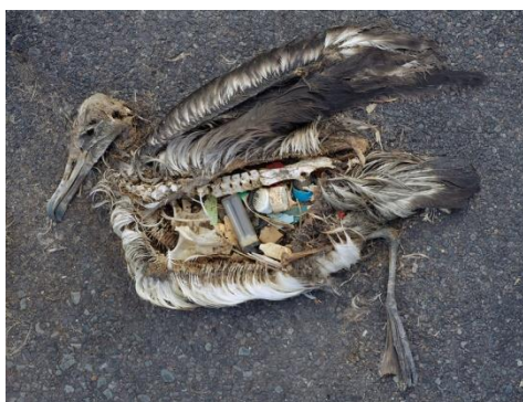
Resíduos de plástico no estômago de um albatroz, Ilhas Midway

garrafas e sacos de plástico enquanto que os pequenos plásticos – também intitulados