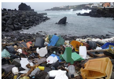
Resíduos de plástico numa praia da Ilha dos Açores.

Se o ser humano é capaz de contaminar tudo, também consegue remediar este grande fenómeno poluente. As soluções apontadas passam, por exemplo, por substituir as garrafas e recipientes de plástico por vidro, reutilizar os sacos de plástico, usar vestuário que não contenha poliéster (plástico), reduzir o uso de copos e pratos descartáveis e recusar usar